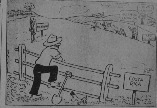
Antes se decía: "La unión hace la fuerza", ahora dicen: "LA UNION se hace a la fuerza".

El 15 de setiembre, tomado como base para la campaña de la Unión Centroamericana, será precisamente el día en que se suscitó un fuerte tiroteo en San Salvador.