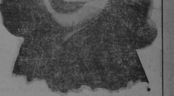
JOAN LESLIE—la encantadora estrella de la gran película musical de la Warner Bros., "HARPSICORDIA EN AZUL"